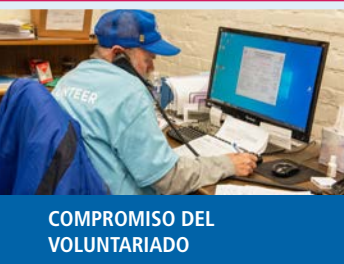
CAMBIANDO VIDAS PARA SIEMPRE (CLF)